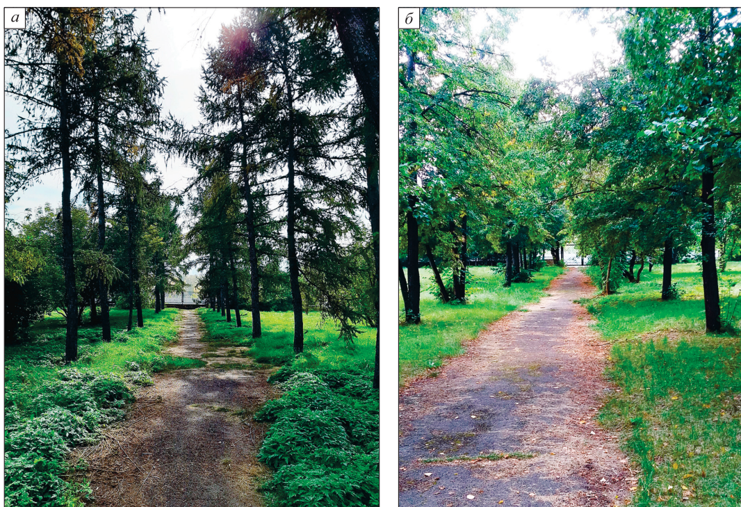
Рис. 1. Лиственничная (а) и липовая (б) аллеи в Центральном парке Красноярска (юго-восточная часть, 2020 г.).

ту кроны, наличию и доле усохших ветвей, состоянию коры и др.): I – без признаков ослабления; II – ослабленные; III – сильно ослабленные; IV – усыхающие; V – свежий сухостой, VI – старый сухостой; VII – аварийные деревья.